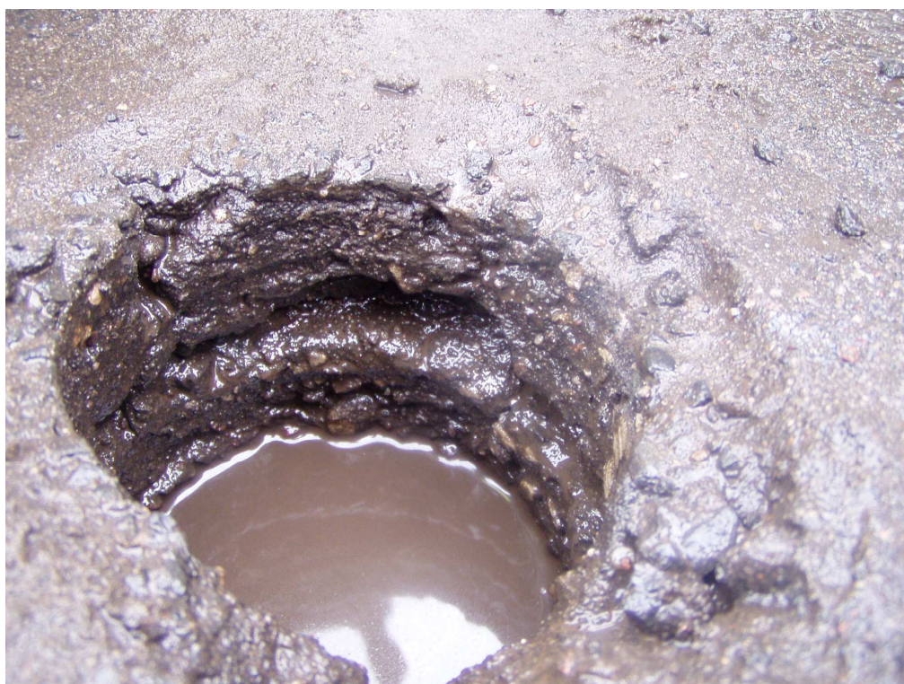
Km 2+300 próbka gr. 9cm rozsypała się podczas wiercenia