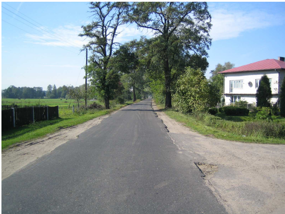
Droga powiatowa nr 1708 E km 5+900 – m. Zwierzyniec Widok od strony miejscowości Brzeźnio