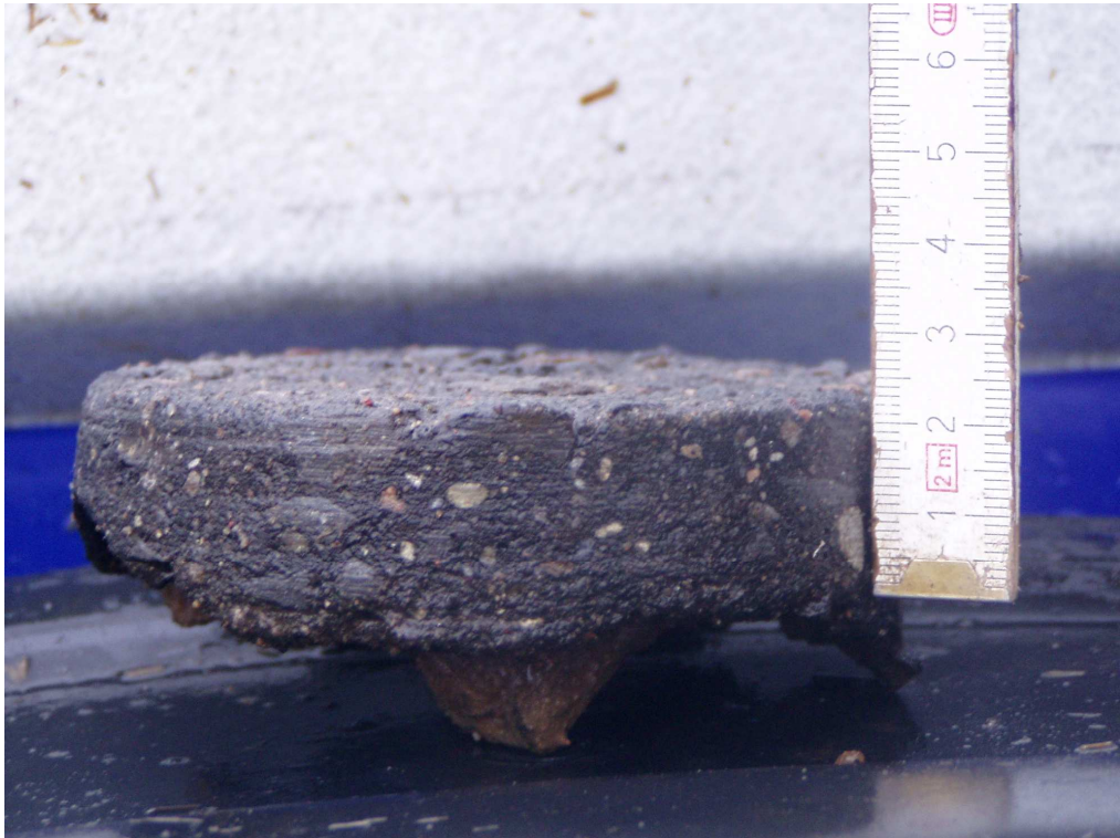
Km 7+000 próbka gr. 2,5cm