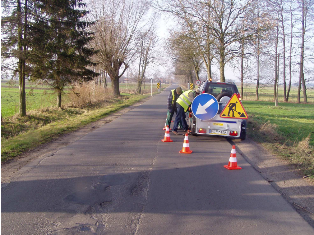
Km 0+500 nawierzchnia bitumiczna – odwierty