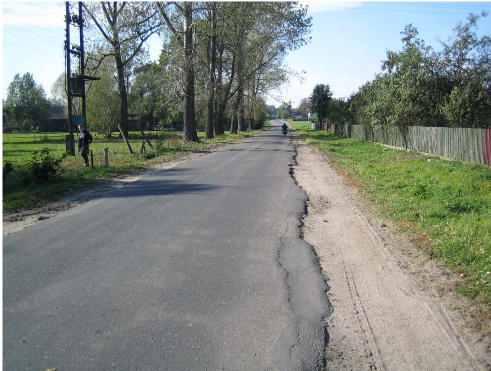
Droga powiatowa nr 1708 E km 6+600 – m. Szczesie Widok od strony miejscowości Brzeźnio