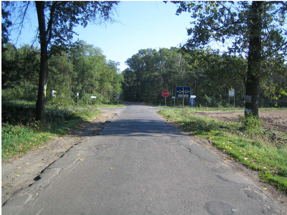
Droga powiatowa nr 1708 E km 5+440 – skrzyżowanie z drogą powiatową relacji Błaszki – Złoczew; widok od strony miejscowości Brąszewice