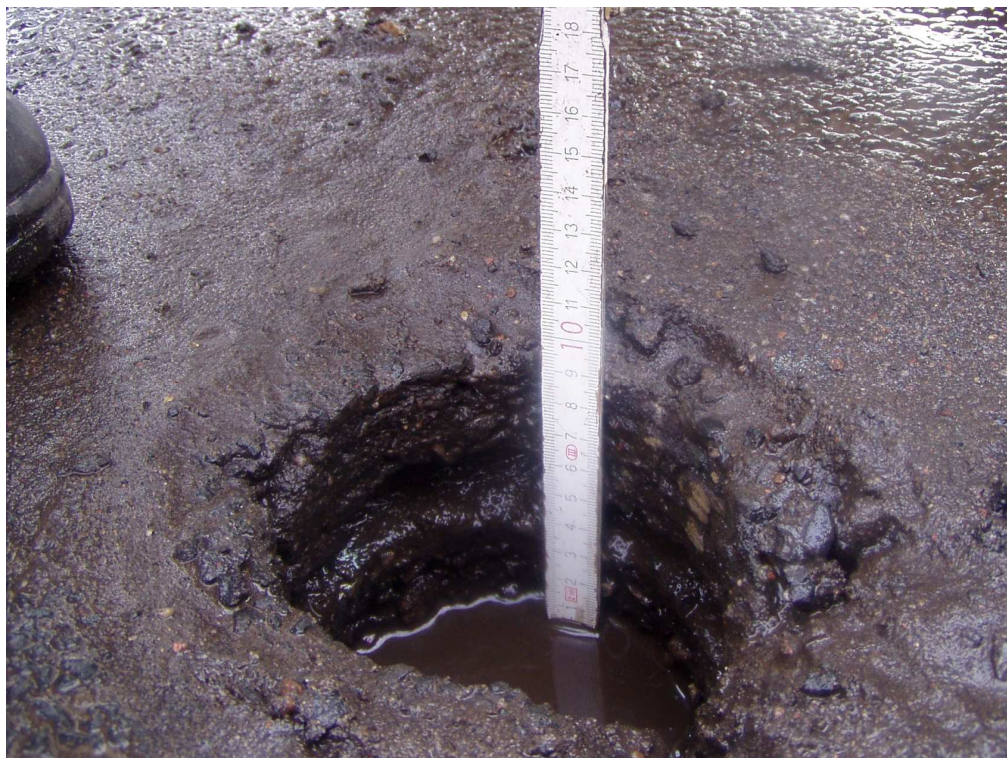
Km 2+300 nawierzchnia bitumiczna – stan techniczny