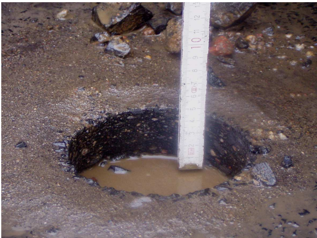
Km 7+200 próbka gr. 4,5cm - miejscowość Szczesie