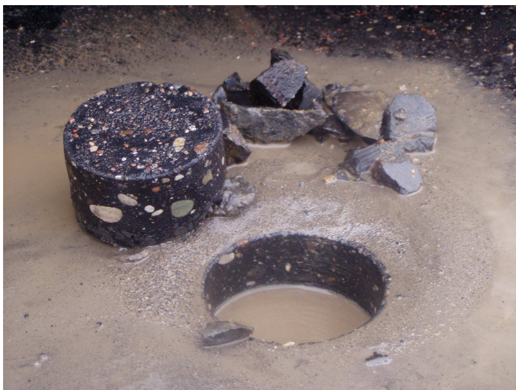
Km 3+900 nawierzchnia bitumiczna gr. 5cm