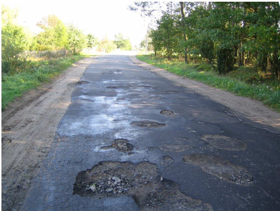
Droga powiatowa nr 1708 E km 7+100 – stan techniczny nawierzchni Widok od strony miejscowości Brąszewice