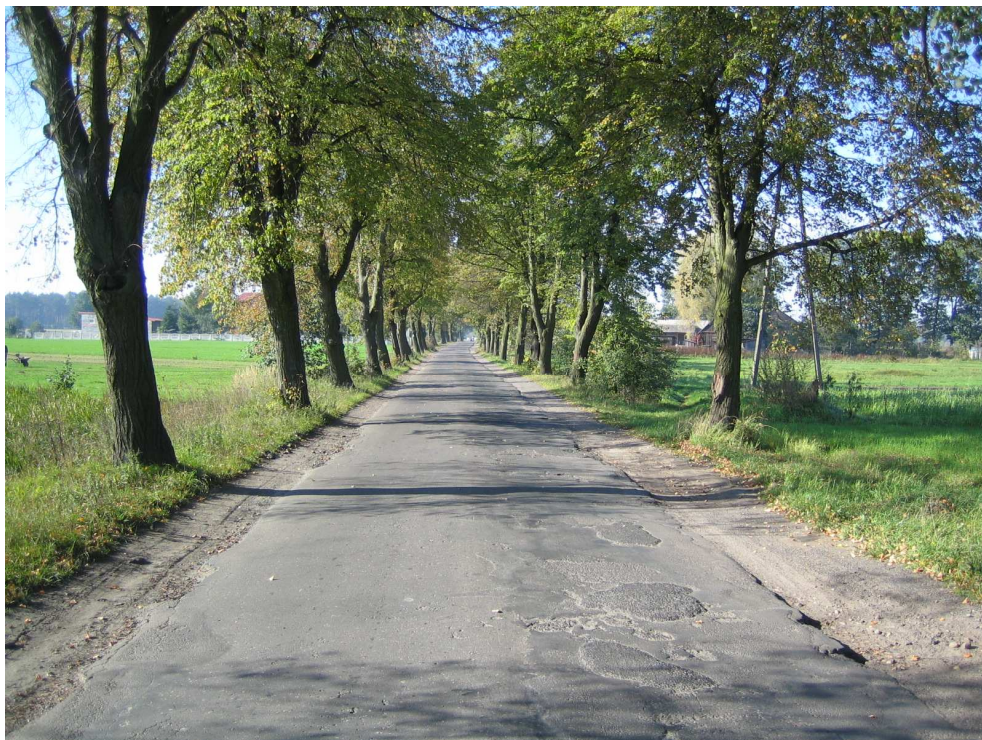
Droga powiatowa nr 1708 E km 3+100 – stan techniczny nawierzchni Widok od strony miejscowości Brzeźnio