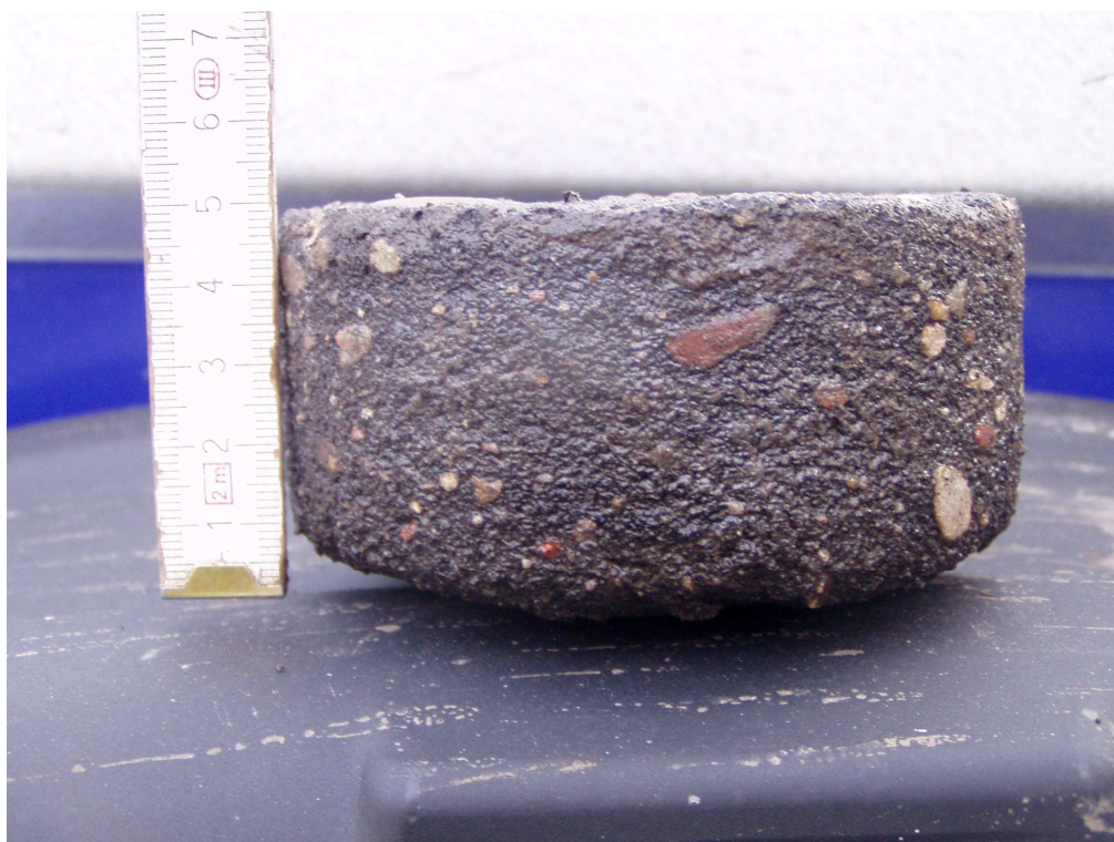
Km 1+700 nawierzchnia bitumiczna gr. 3,5+6+4cm