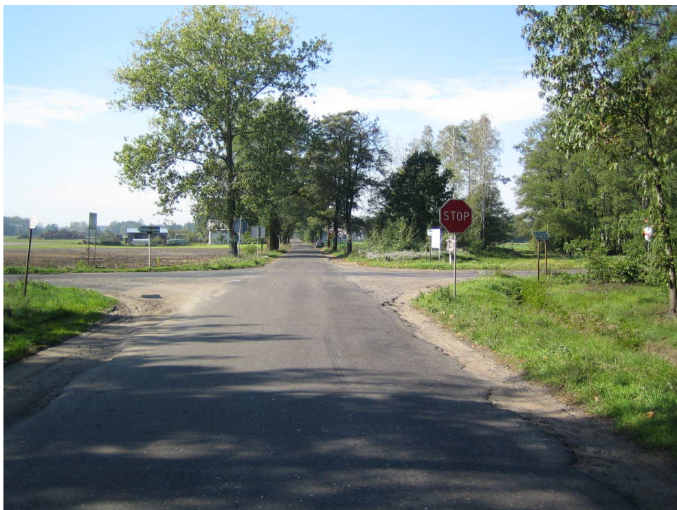
Droga powiatowa nr 1708 E km 5+440 – skrzyżowanie z drogą powiatową relacji Błaszki – Złoczew; widok od strony miejscowości Brzeźnio