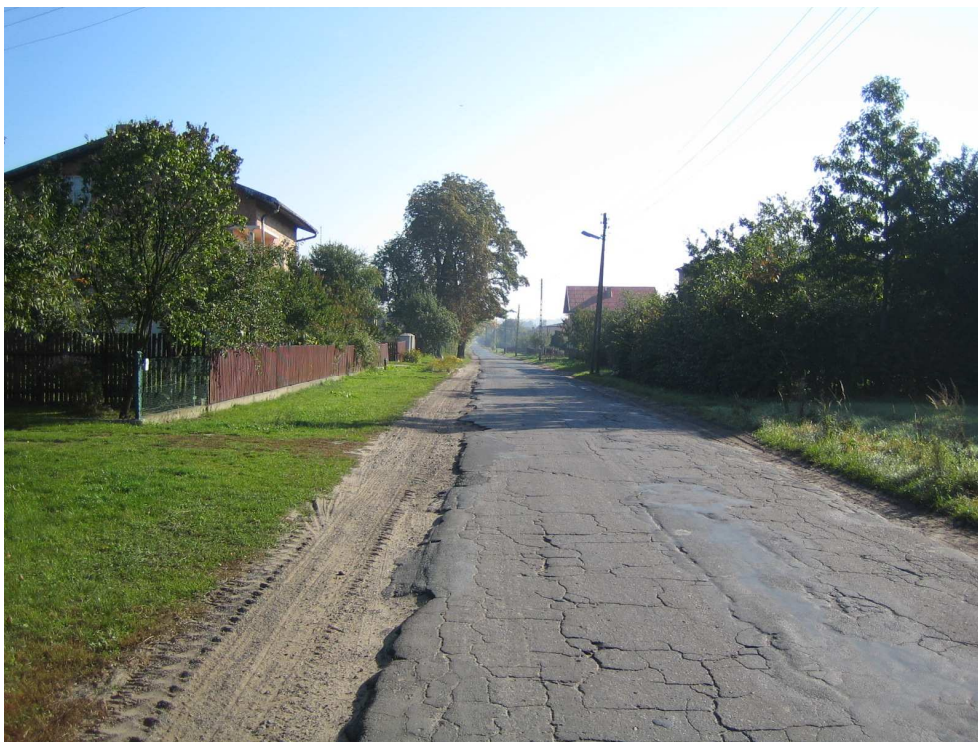
Droga powiatowa nr 1708 E km 1+400 – m. Podcabaje Widok od strony miejscowości Brąszewice