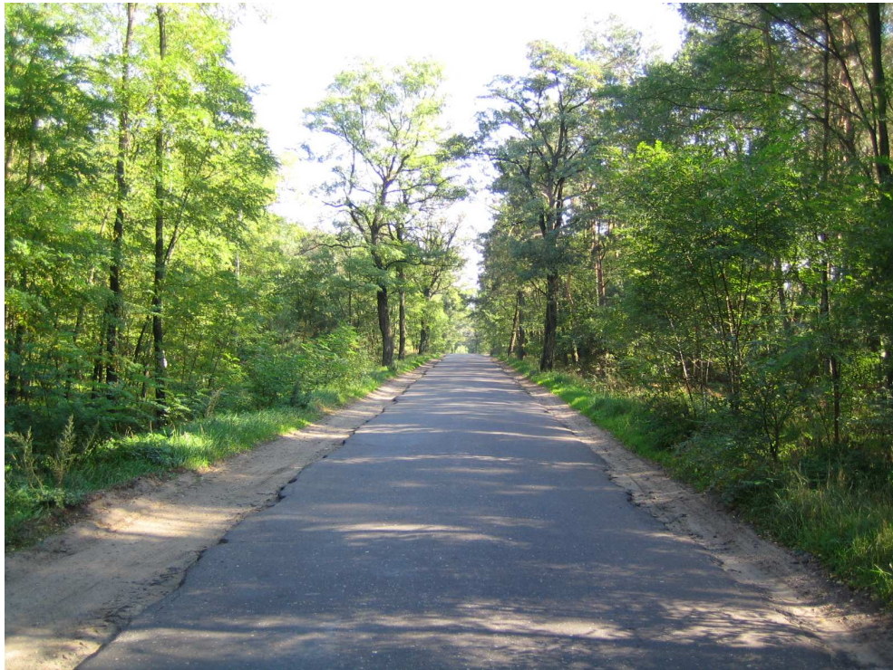
Droga powiatowa nr 1708 E km 4+700 – stan techniczny drogi Widok od strony miejscowości Brąszewice