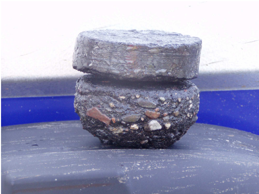
Km 0+500 nawierzchnia bitumiczna gr. 3+6cm