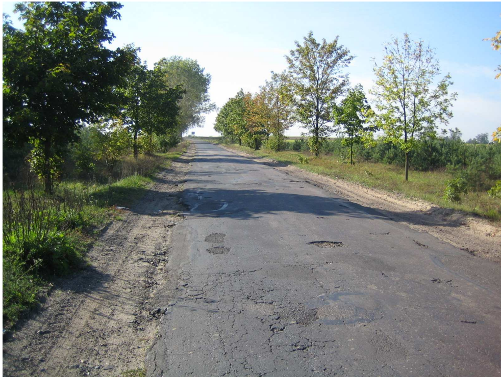
Droga powiatowa nr 1708 E km 7+600 – stan techniczny nawierzchni Widok od strony miejscowości Brzeźnio