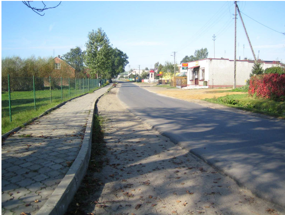
Droga powiatowa nr 1708 E km 2+500 – m. Ostrów Widok od strony miejscowości Brzeźnio