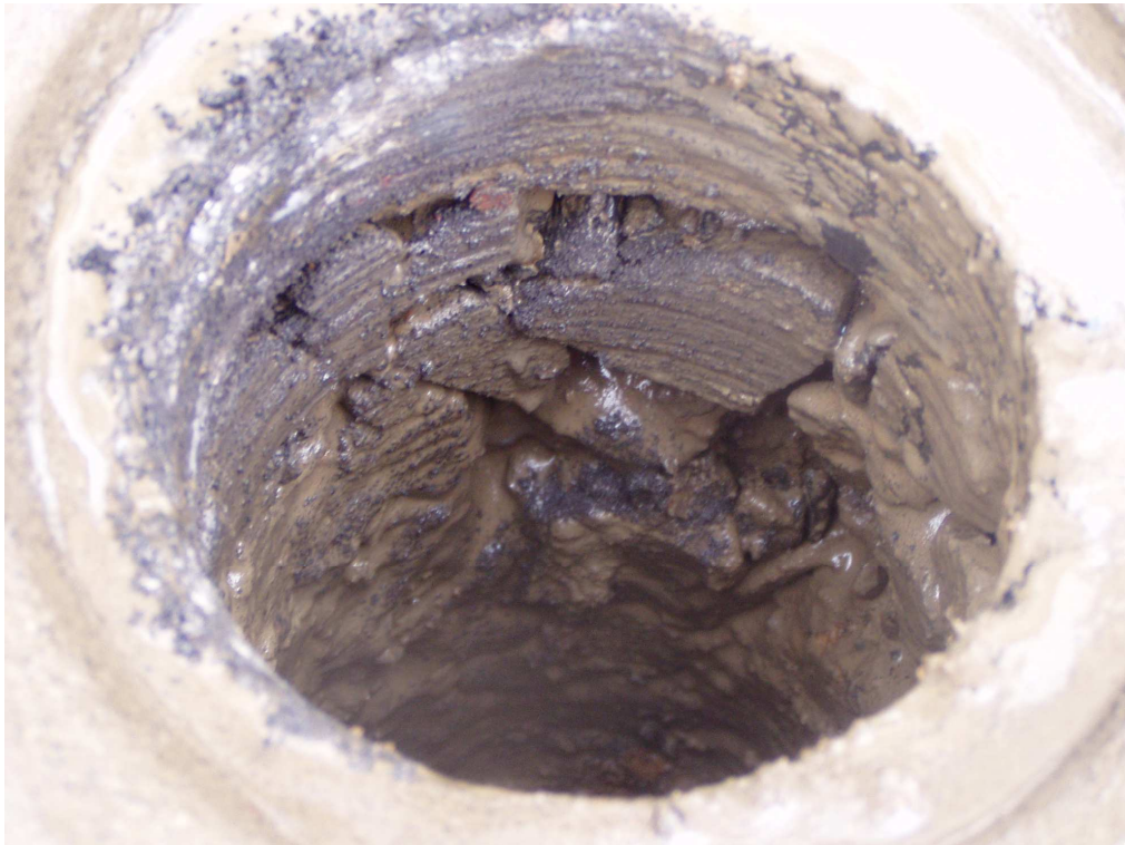
Km 3+900 podbudowa z tłucznia kamiennego gr. 35