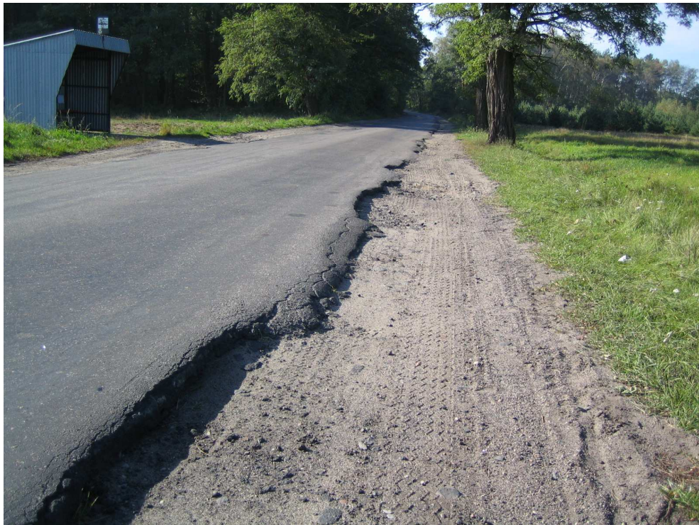
Droga powiatowa nr 1708 E km 3+900 – stan techniczny nawierzchni Widok od strony miejscowości Brzeźnio – strona prawa