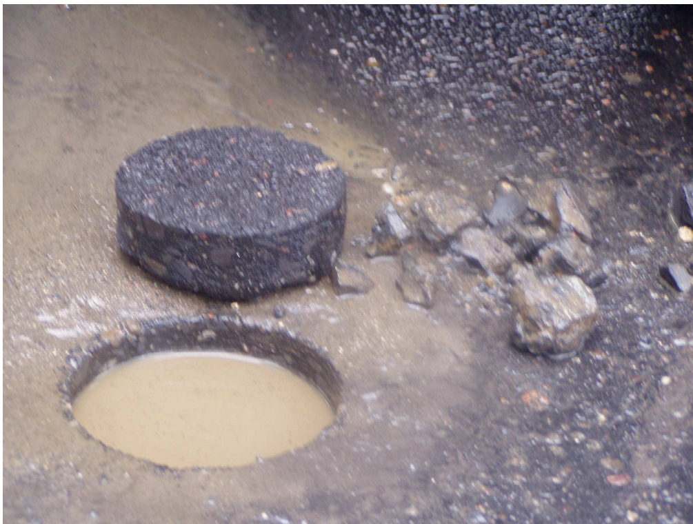
Km 6+000 próbka gr. 3,0cm