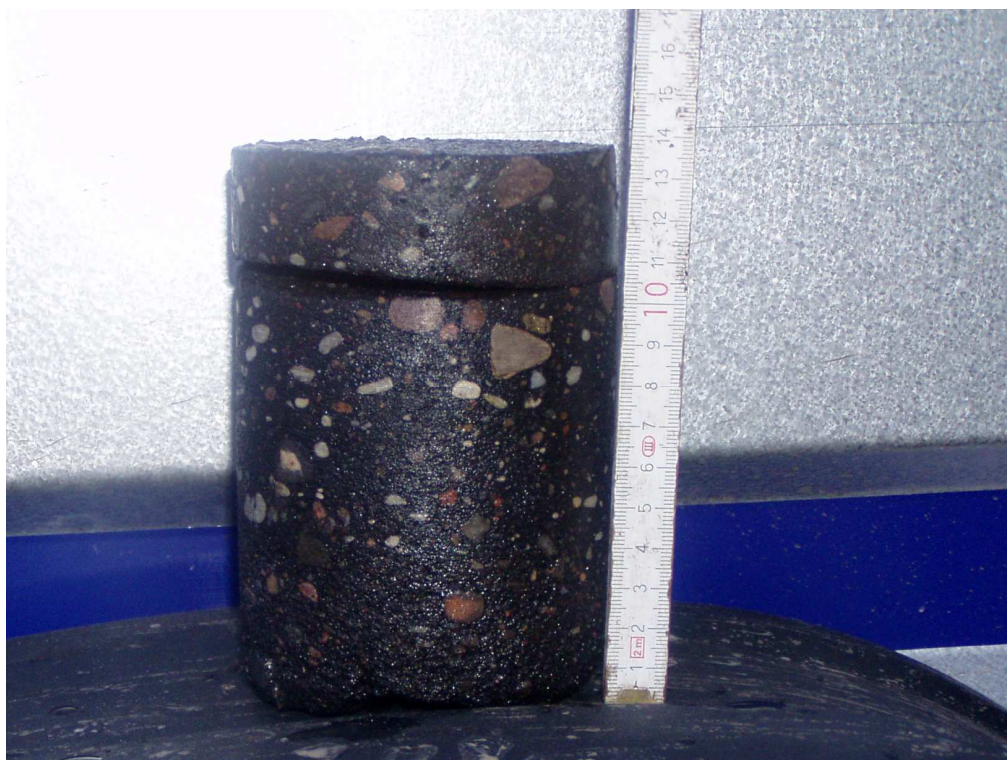
Km 3+300 nawierzchnia bitumiczna gr. 3+10,5cm