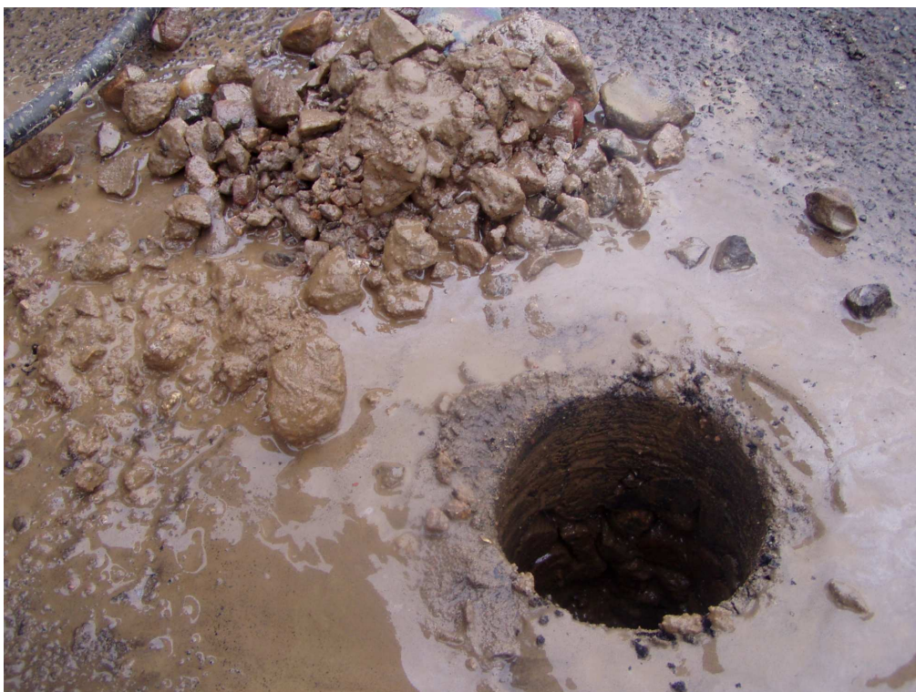
Km 6+000 podbudowa z tŁuczniŁ kamieniego gr. 32cm