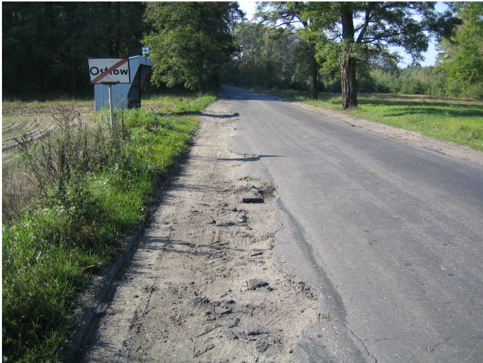
Droga powiatowa nr 1708 E km 3+900 – stan techniczny nawierzchni Widok od strony miejscowości Brzeźnio – strona lewa