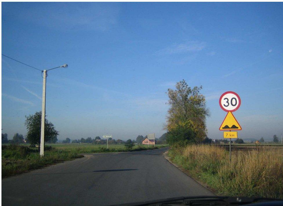
Droga powiatowa nr 1708 E km 0+000 P.P.T