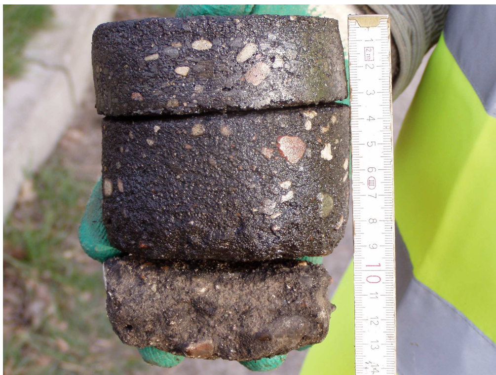
Km 1+300 nawierzchnia bitumiczna gr. 3,5+6+4cm (prawy pas nawierzchnia o 4cm grubsza od pasa lewego)