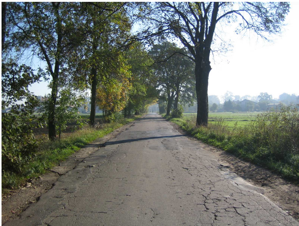
Droga powiatowa nr 1708 E km 0+300 – stan techniczny nawierzchni Widok od strony miejscowości Brzeźnio