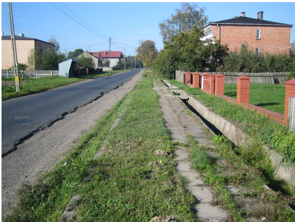
Droga powiatowa nr 1708 E km 1+400 – m. Podcabaje Widok od strony miejscowości Brzeźnio