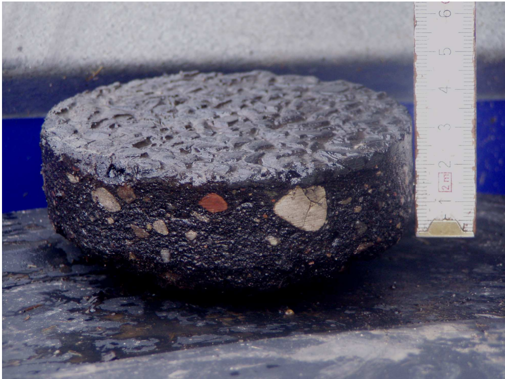
Km 2+700 miejscowość Ostrów nawierzchnia bitumiczna gr. 3cm