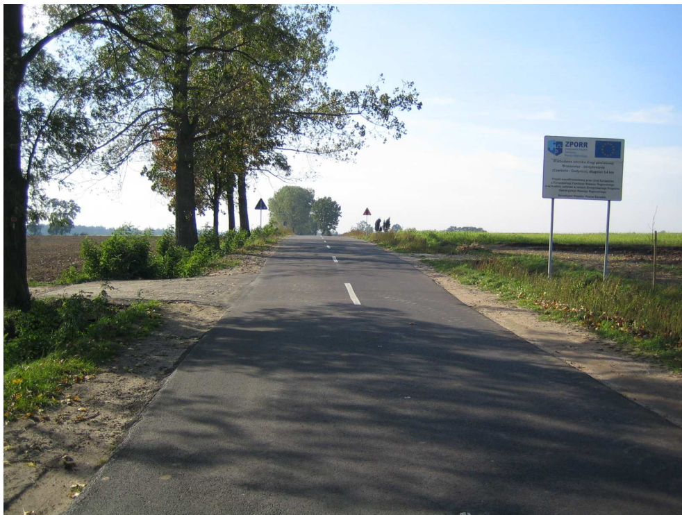
Droga powiatowa nr 1708 E km 7+800 – K.P.T Widok od strony miejscowości Brzeźnio