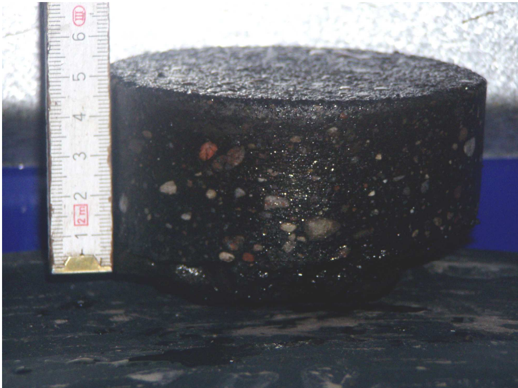
Km 4+100 nawierzchnia bitumiczna gr. 5cm