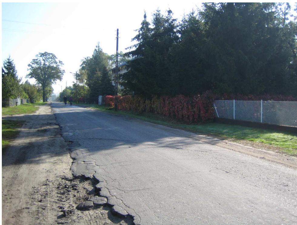
Droga powiatowa nr 1708 E km 2+000 – m. Podcabaje Widok od strony miejscowości Brąszewice